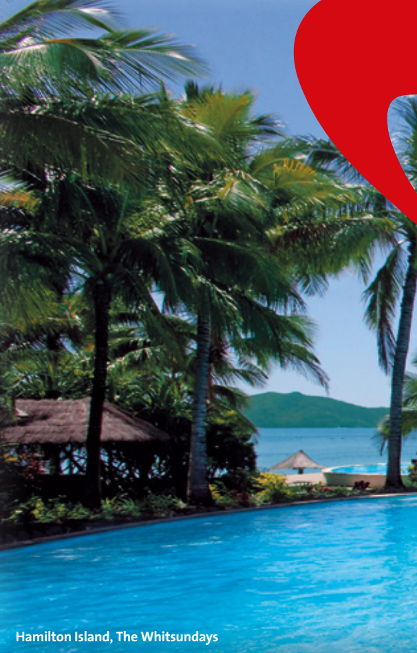
Hamilton Island, The Whitsundays