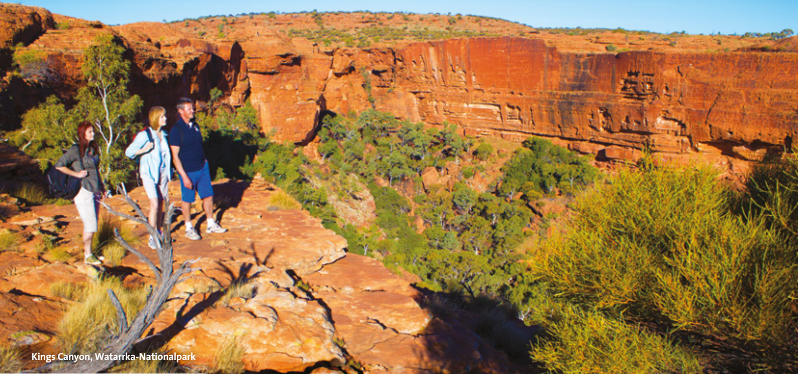
Kings Canyon, Watarrka-Nationalpark