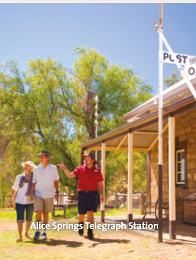
Alice Springs Telegraph Station