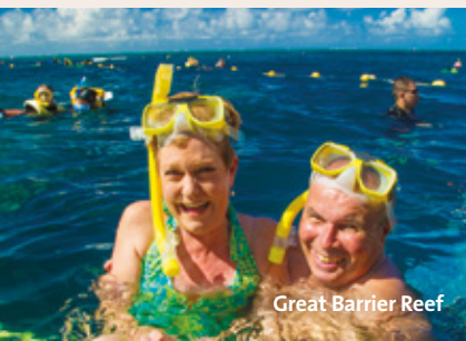
Great Barrier Reef

Freie Zeit bis zu Ihrem Transfer zum Flughafen. F