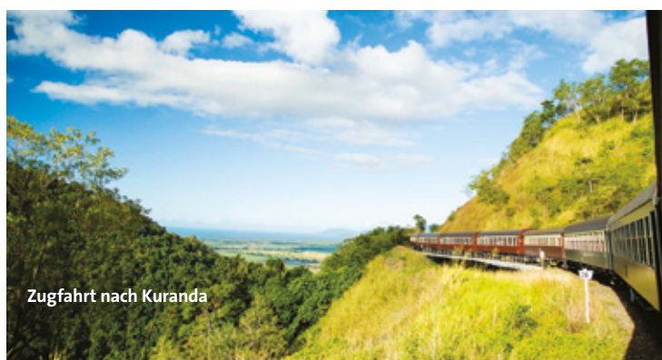
Zugfahrt nach Kuranda

„Beim Betreten des unberührten Strandes fühlt man sich wie der erste Mensch auf dem Mond.“