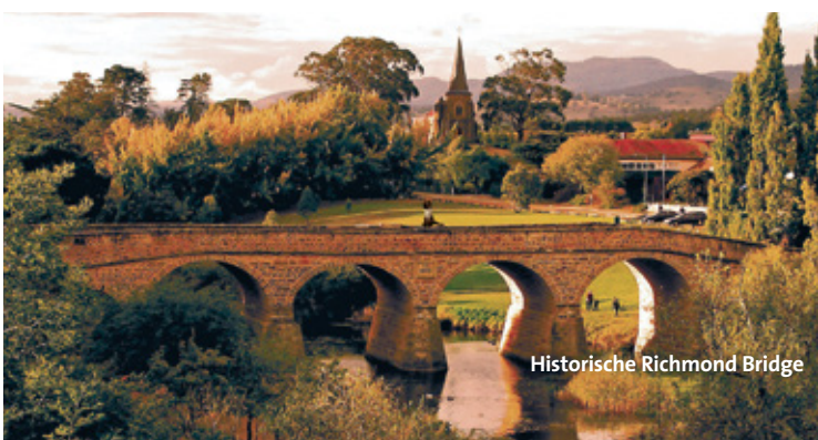
Historische Richmond Bridge