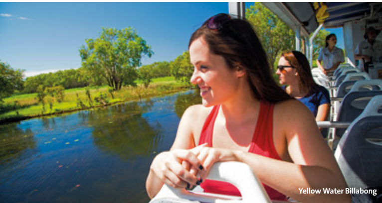
Yellow Water Billabong