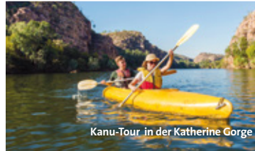
Kanu-Tour in der Katherine Gorge