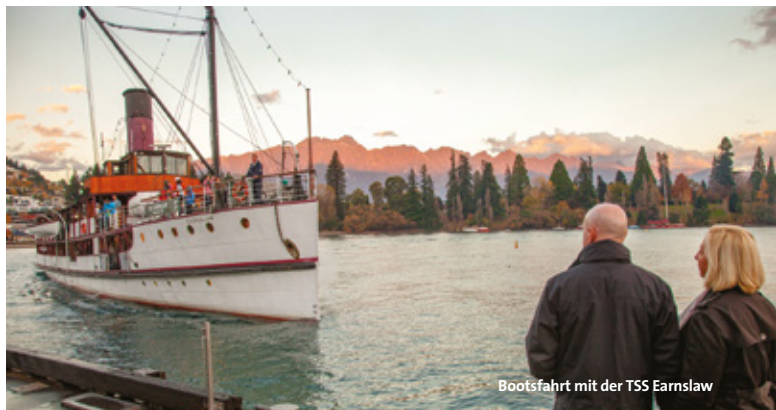
Bootsfahrt mit der TSS Earnslaw