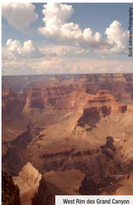
West Rim des Grand Canyon