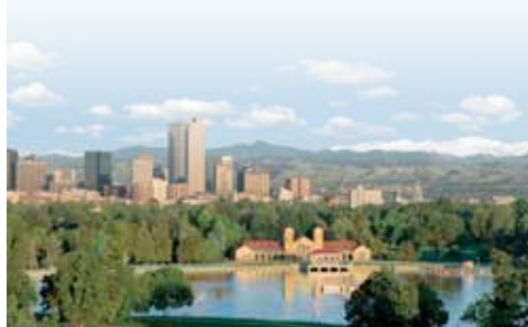
Skyline von Denver

19. Tag: Denver. Heute endet Ihre Mietwagen-Rundreise durch Utah, Colorado und Arizona.