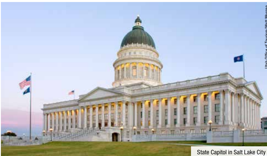
State Capitol in Salt Lake City

10. und 11. Tag: Yellowstone Nationalpark. Der Yellowstone NP ist der älteste Nationalpark der Welt und verfügt aufgrund seiner einmaligen Lage über der Magmakammer des Yellowstone Vulkans über eine Vielzahl an heißen Quellen und Geysiren. Besonders beliebt ist der Old Faithful Geysir, der sein Wasser alle 60 bis 90 Minuten wieder in die Höhe spuckt, genießen Sie dieses Schauspiel! Ein weiteres Highlight ist der Grand Canyon of Yellowstone mit einigen Wasserfällen und Aussichtspunkten. Auch die Tierwelt hält so einige Überraschungen für Sie bereit: begegnen Sie Bisons, Pumas, Wölfen und Grizzlybären.