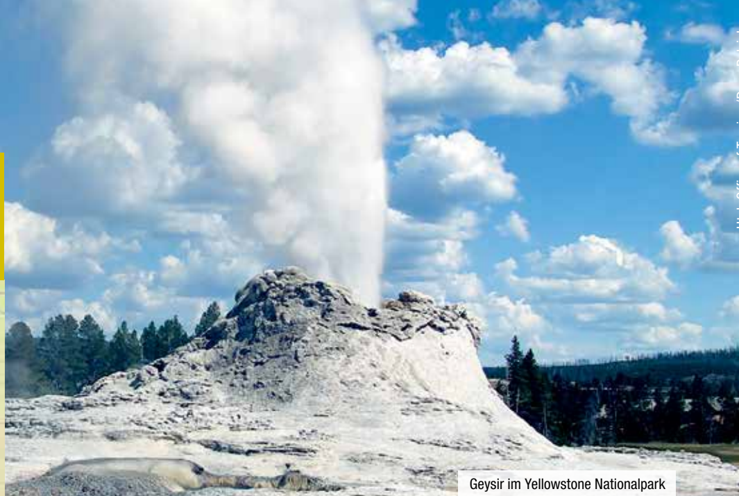
Geysir im Yellowstone Nationalpark

Diese beeindruckende Reise ist gespickt von Highlights in den nördlichen Rockies der USA. Von bedeutenden Nationalparks wie dem Yellowstone Nationalpark und dem Glacier Nationalpark bis hin zur Olympiastadt von 2002, Salt Lake City. Freuen Sie sich auf eine interessante Tour durch die Mountain States und auf Begegnungen mit Büffeln, Elchen und Bären.