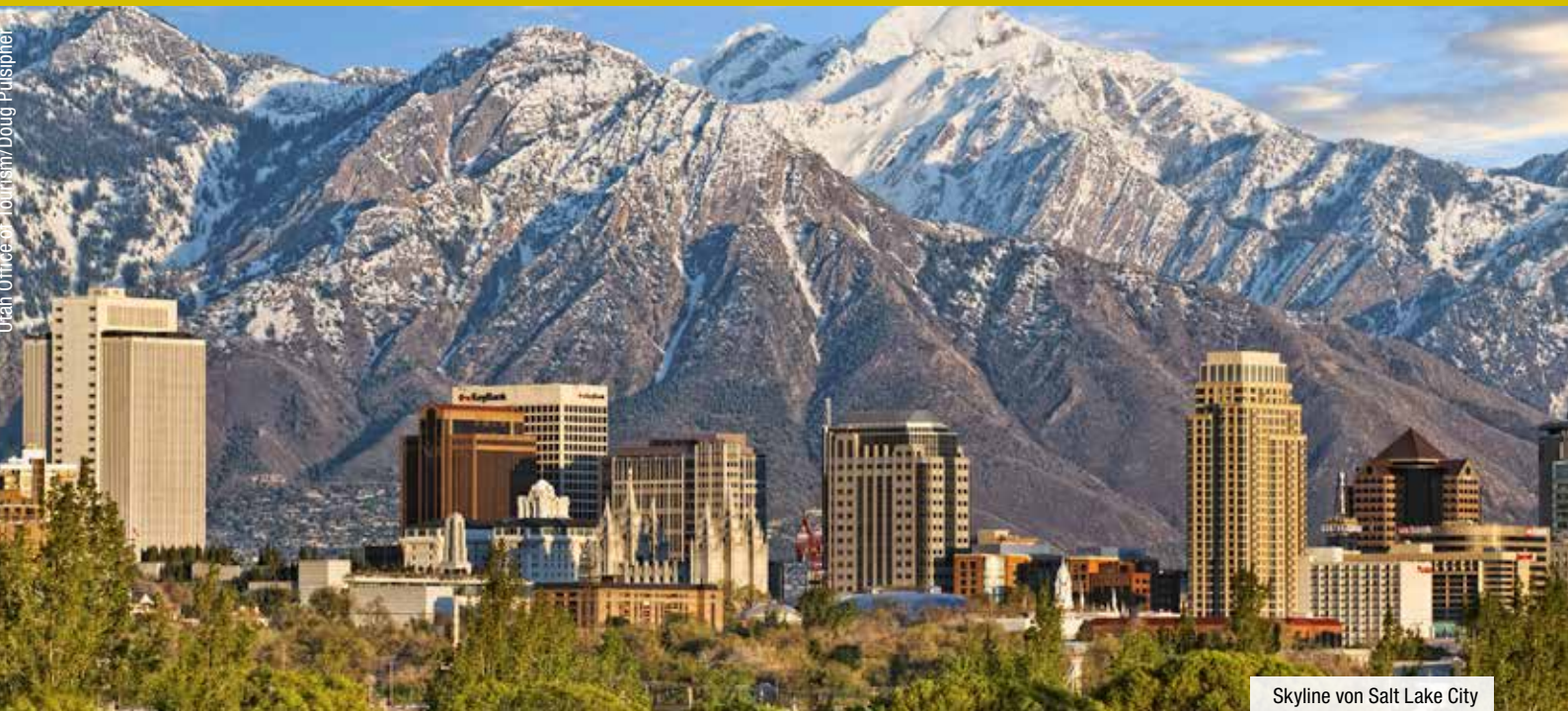
Skyline von Salt Lake City

12. Tag: Yellowstone Nationalpark - Jackson (ca. 130 km). Heute fahren Sie entlang der Bergkette des Grand Teton NP in Richtung Jackson. 2 Ü: Painted Buffalo Inn**+.