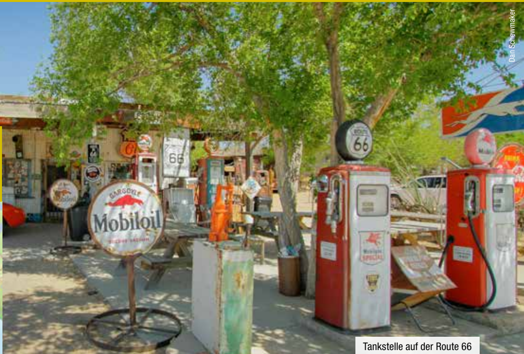
Tankstelle auf der Route 66

Erfüllen Sie sich Ihren Traum und fahren Sie mit dem Mietwagen auf der legendären Route 66. Die bekannteste Straße Nordamerikas entstand mit dem Trek der Pioniere und führt entlang interessanter Städte und Sehenswürdigkeiten von Chicago nach Los Angeles. Erleben Sie den Mythos der Route 66!