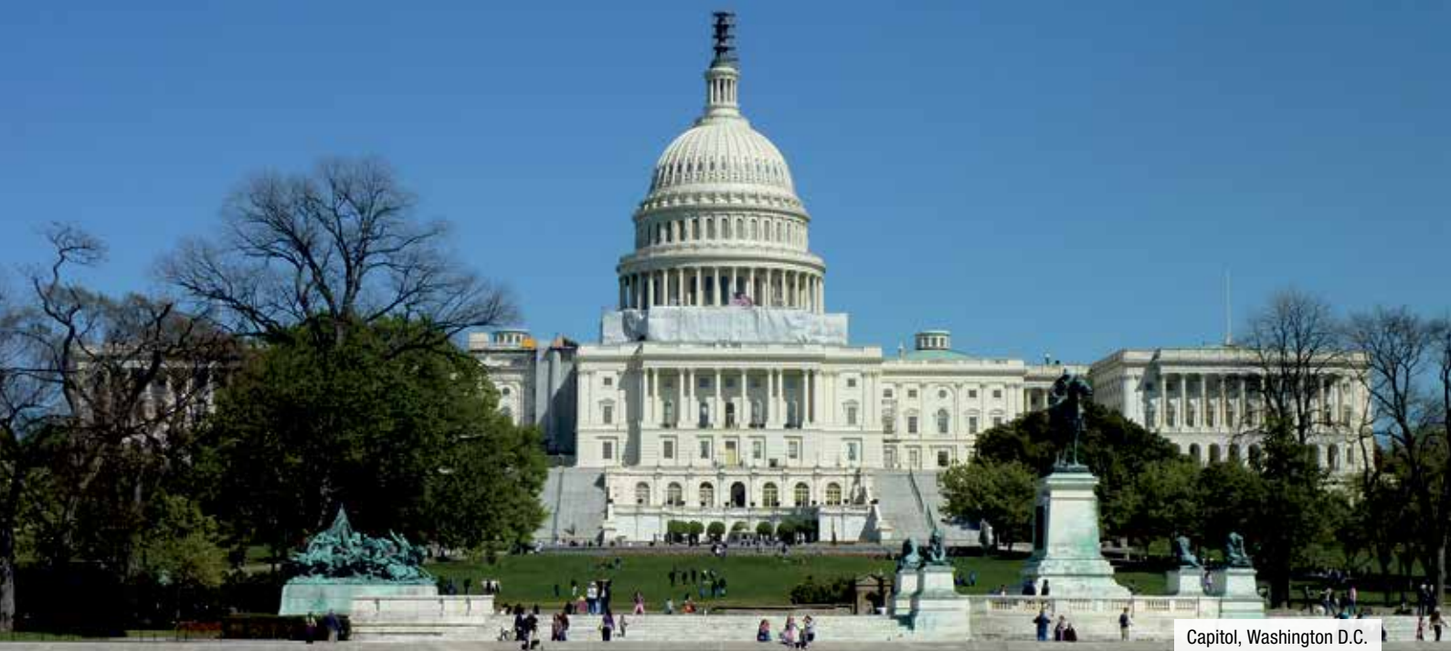
Capitol, Washington D.C.

und verfolgen dann die beeindruckende Zeremonie der Wachablösung. Der Rideau Canal, der den Ottawafluss mit dem Ontariosee verbindet, bietet Ihnen im Sommer die Möglichkeit eine Bootstour zu unternehmen und im Winter auf der größten Eislaufbahn der Welt sein Glück zu versuchen. 1 Ü: Hotel Indigo****.