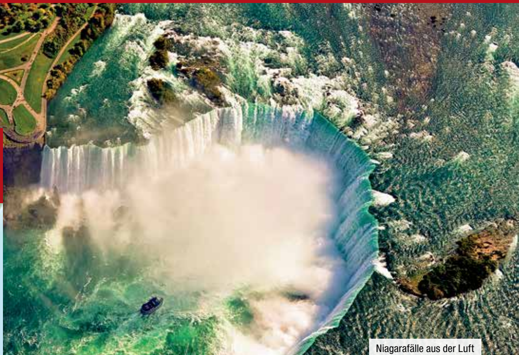
Niagarafälle aus der Luft

Auf dieser Reise erleben Sie die schönsten Seiten Nordamerikas. Die klassische Busrundreise beginnt in New York und führt durch Neuengland nach Québec, Montreal, in den 1000 Islands Nationalpark, nach Toronto und schließlich zu den Niagarafällen. Von dort geht es zurück in die USA nach Washington D.C., Philadelphia und New York.