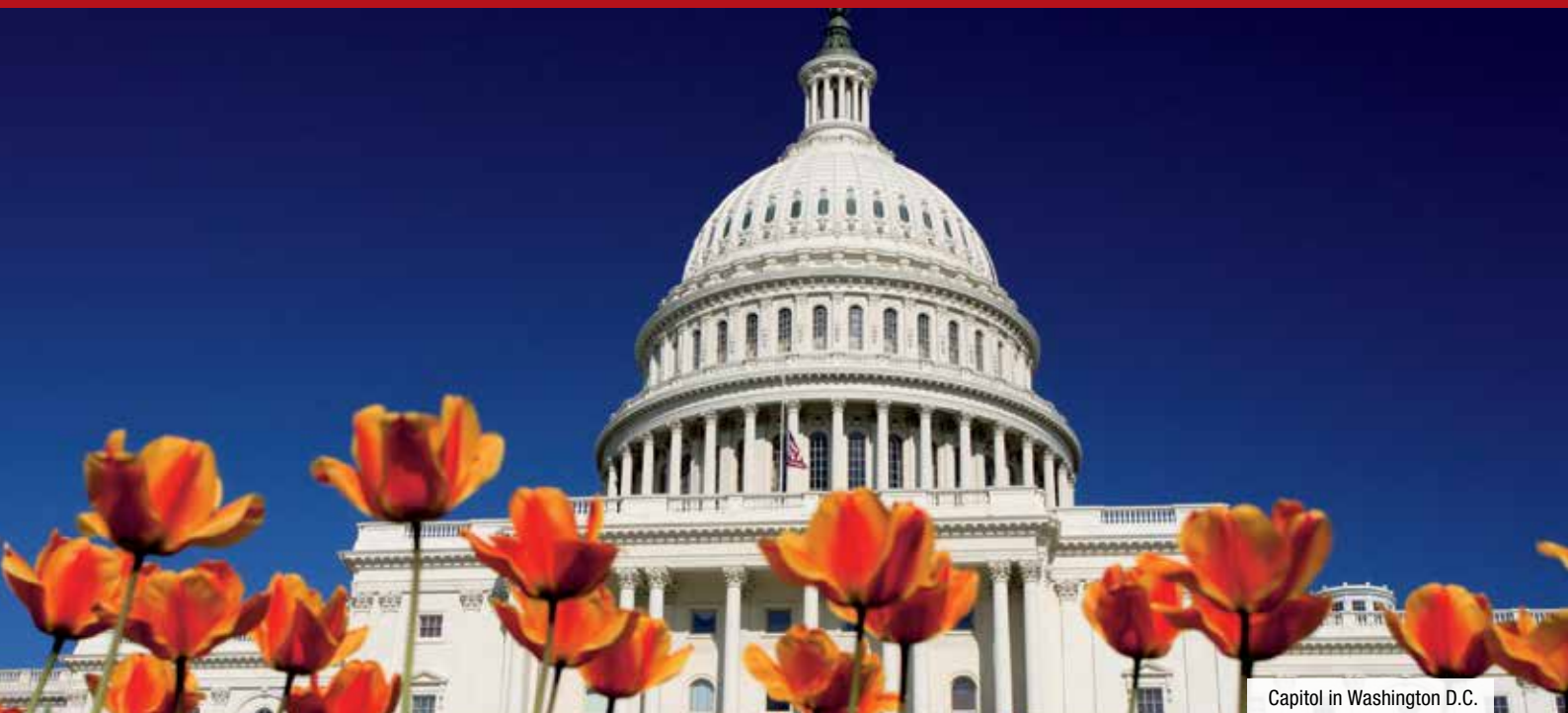
Capitol in Washington D.C.

mit AMTRAK heute weiter Richtung Süden nach Charleston in South Carolina. 2 Ü: Holiday Inn Riverview*** (Standard) / Francis Marion Hotel****+ (Select).