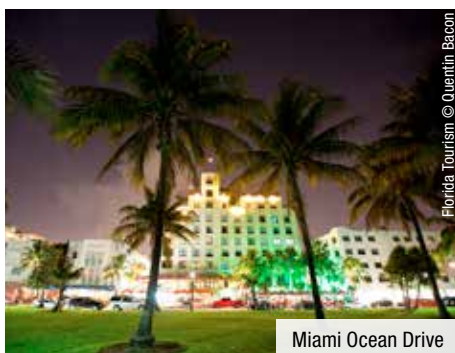
Miami Ocean Drive

13. Tag: Orlando. In der Vergnügungs-Metropole haben Sie die Qual der Wahl zwischen einem Besuch in Disney World, Sea World, den Universal Studios und vielen anderen Themenparks (optional). Ein Paradies für Junge und Junggebliebene!