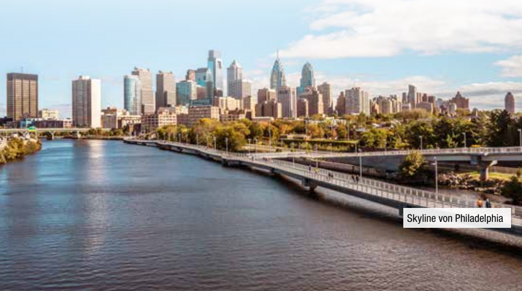
Skyline von Philadelphia

17. Tag: Miami. Auch der schönste Urlaub geht einmal zu Ende. Individueller Transfer zum Flughafen.