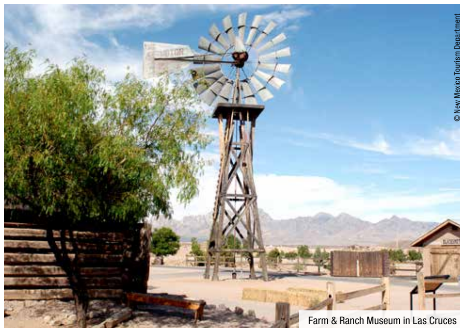
Farm & Ranch Museum in Las Cruces