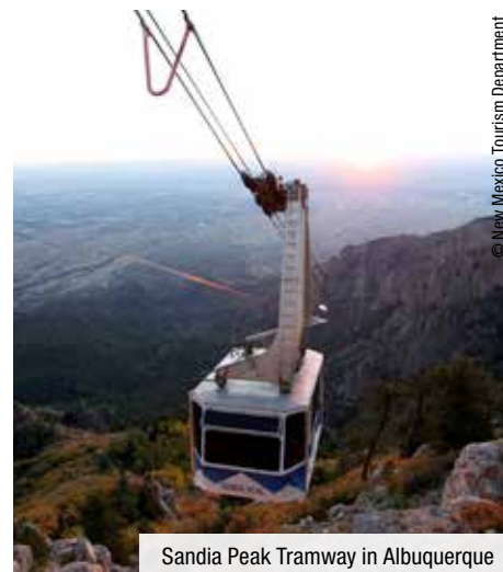
Sandia Peak Tramway in Albuquerque

5. Tag: Abiquiu - Bandelier Nationalpark - Santa Fe (F/M). Auf dem Weg nach Santa Fe, der schönsten und ältesten Stadt der USA, unternehmen Sie eine Wanderung im Bandelier NP. Sie wandern etwa 1 Stunde im Canyon zu 1.000 Jahre alten Ruinen der Anasazi Indianer. Eine spektakuläre, aber leichte Kletterei über einige Leitern führt Sie hinauf zu einer großen Höhle und einer noch gut erhaltenen Behausung. Auf dem Rückweg können Sie die restlichen Höhlenbehausungen der Indianer erkunden. 2 Ü: Fort Marcy Hotel***.