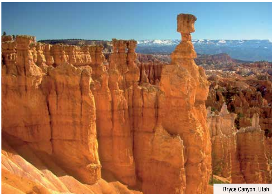
Bryce Canyon, Utah

9. Tag: Las Vegas - Death Valley Nationalpark (F/M). Heute fahren Sie durch das Death Valley, wo extreme Temperaturen und Witterungsbedingungen herrschen. Hier haben Sie Zeit die goldenen Sanddünen, die Vielzahl