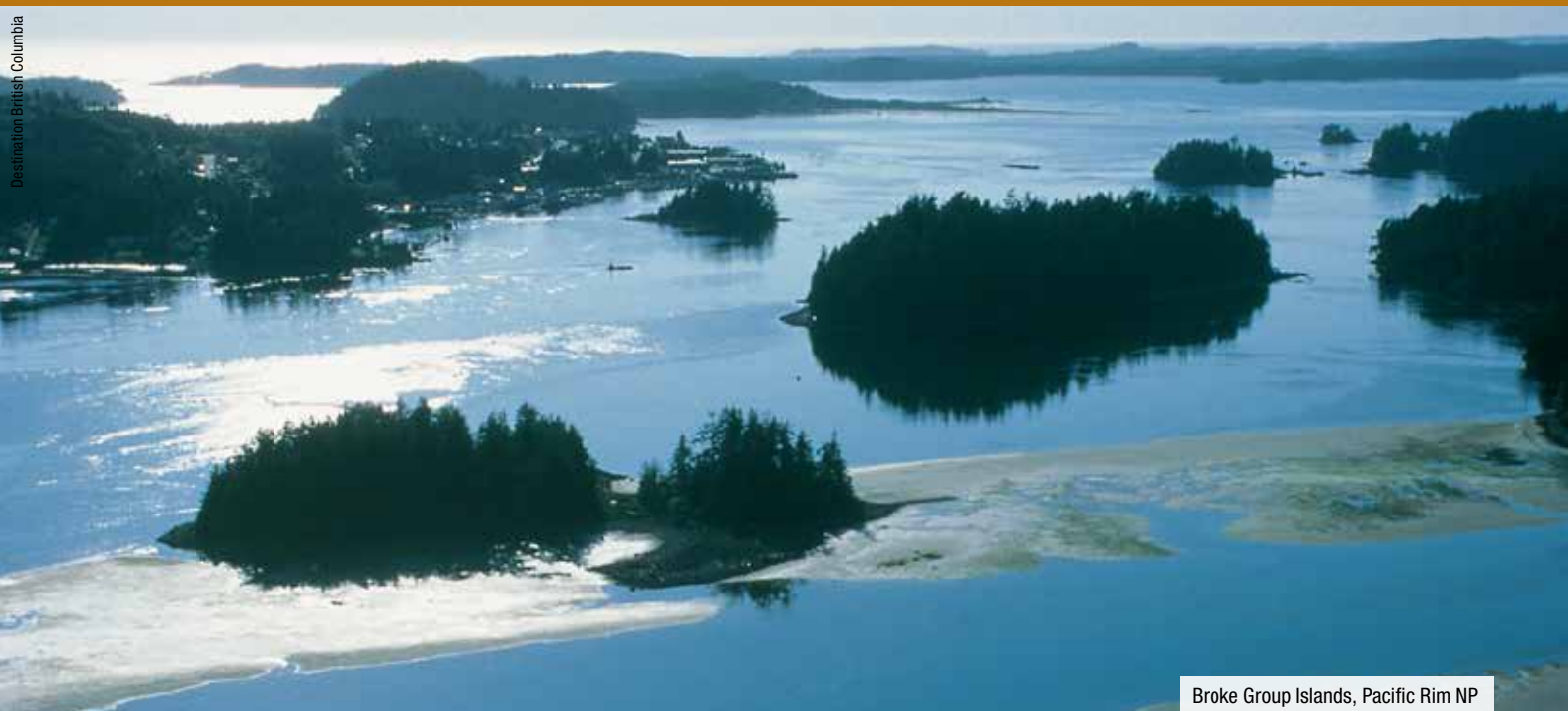
Broke Group Islands, Pacific Rim NP

turliebhaber. Hier finden Sie diverse Naturschauspiele wie die Helmcken und Dawson Falls sowie erloschene Vulkane, Lavabetten, Mineralquellen und Gletscher. Eine Kanutour auf dem Clearwater Lake darf genauso wenig auf Ihrem Programm fehlen wie eine Wanderung mit gleichzeitiger Tierbeobachtung.