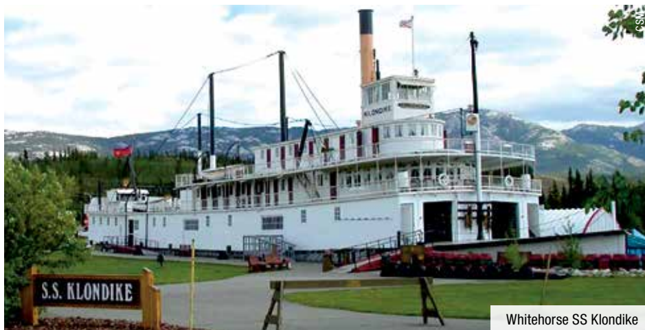
Whitehorse SS Klondike