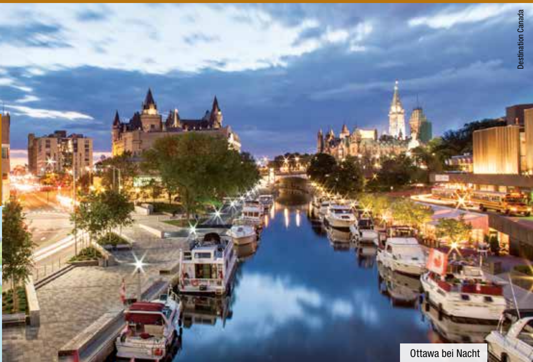
Ottawa bei Nacht

Auf dieser Rundreise erleben Sie die Highlights von Kanada. Sie starten Ihre Reise in den Metropolen des Ostens. Freuen Sie sich auf das französischsprachige Montreal, die Hauptstadt Ottawa und die 8-Millionen-Metropole Toronto. Im Anschluss besuchen Sie die größten Wasserfälle Nordamerikas, die Niagarafälle. Im Westen Kanadas erwarten Sie viele landschaftliche Highlights in den Rocky Mountains und auf Vancouver Island und natürlich die schönen Städte Vancouver und Victoria. Genießen Sie diese abwechslungsreiche Reise!