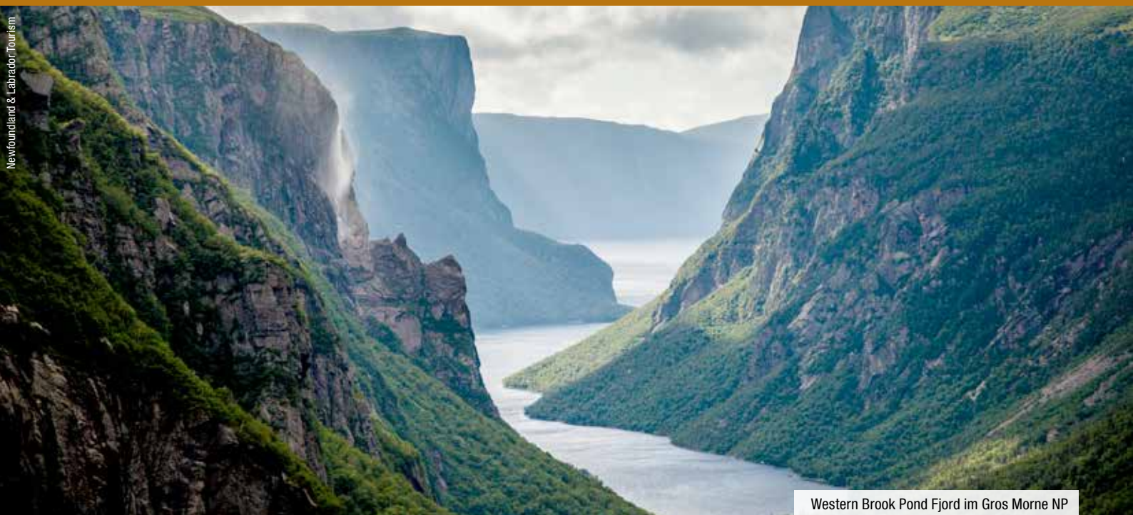
Western Brook Pond Fjord im Gros Morne NP