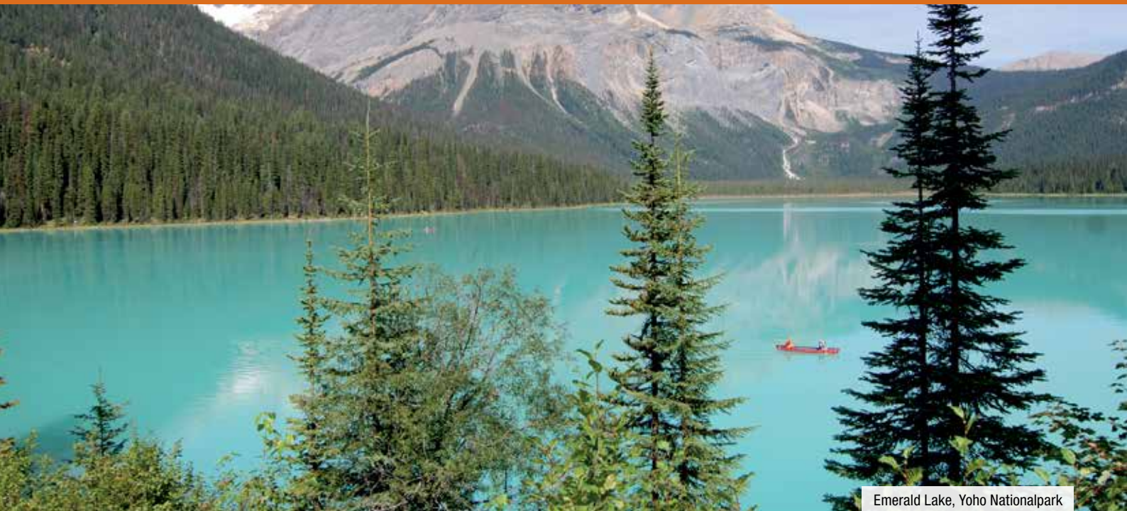
Emerald Lake, Yoho Nationalpark

8. Tag: Prince George - Smithers. Die Fahrt von Prince George nach Smithers vermittelt Ihnen einen sehr guten Eindruck von der Weite des Landes und der typischen Landschaft des Nordwestens. Seen und Wälder soweit das Auge reicht. 1 Ü: Hudson Bay Lodge***.