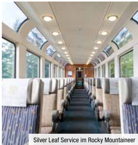
Silver Leaf Service im Rocky Mountaineer

8. Tag: Vancouver. Heute endet Ihre Reise.