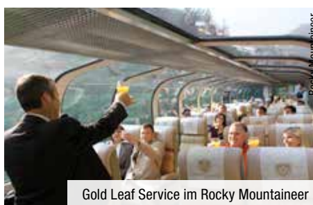
Gold Leaf Service im Rocky Mountaineer

Auf jeder Reise erhalten Sie eine Ausgabe von „The Rocky Mountaineer Mile Post“. Diese besondere Zeitung informiert Sie über alle Sehenswürdigkeiten auf Ihrer Reise und über interessante Geschichten zur durchquerten Region.