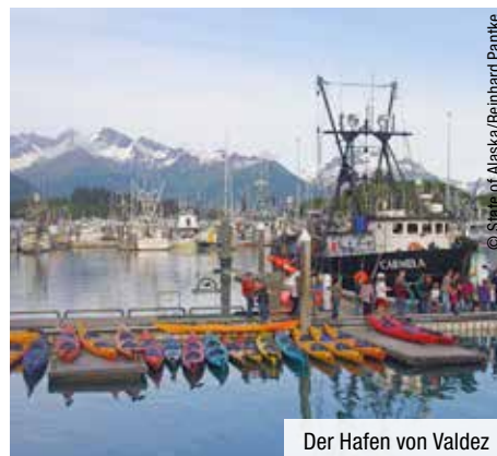
Der Hafen von Valdez

15. Tag: Anchorage. Nutzen Sie den letzten Tag in Anchorage für einen Einkaufsbummel oder besuchen Sie das Aviation Museum. Viele legendäre Flugzeugtypen erwarten Sie hier und machen neugierig auf den Lake Spenard, den größten Flugplatz für Wasserflugzeuge.