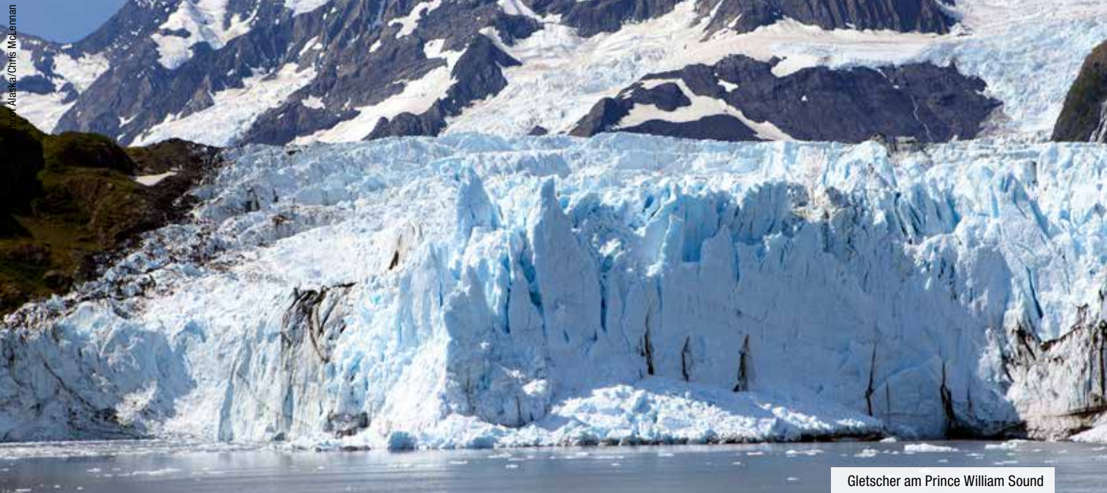
Gletscher am Prince William Sound

Inuvik. Die am Polarmeere gelegene Stadt befindet sich in den North West Territories. Entdecken Sie die Tombstone Mountains und staunen Sie über die spektakuläre Tundra-Landschaft, die gerade in dieser Gegend zu jeder Jahreszeit einen einzigartigen Reiz hat.