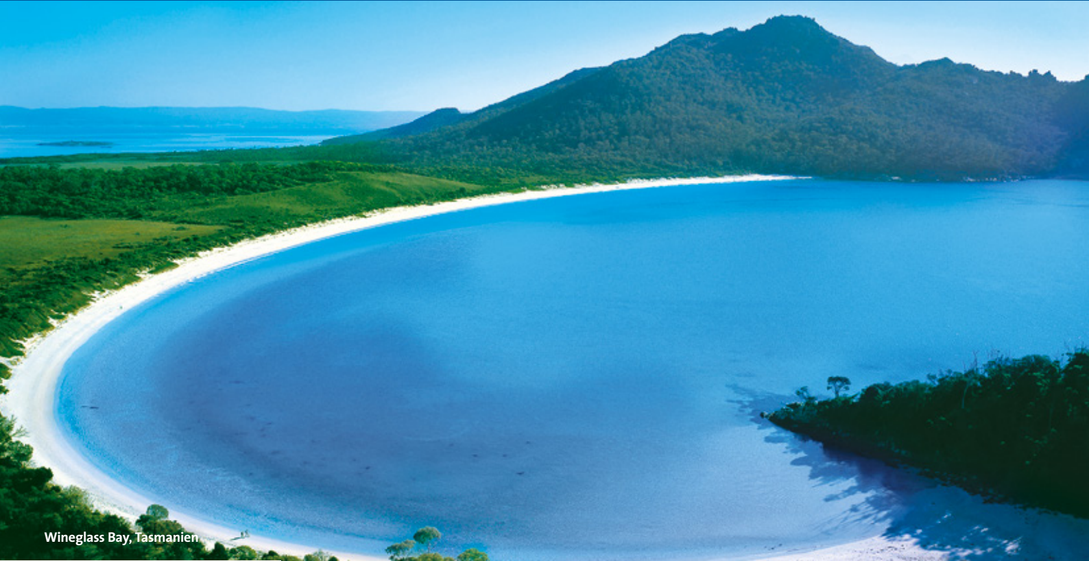
Wineglass Bay, Tasmanien