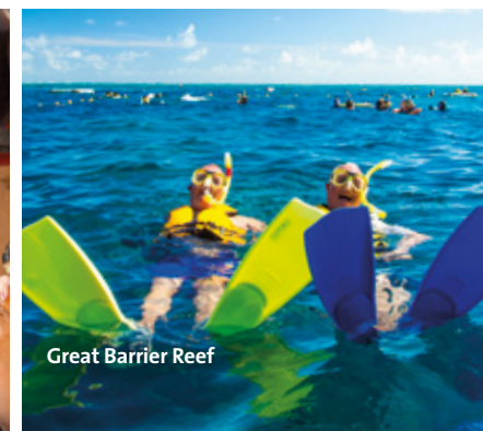
Great Barrier Reef