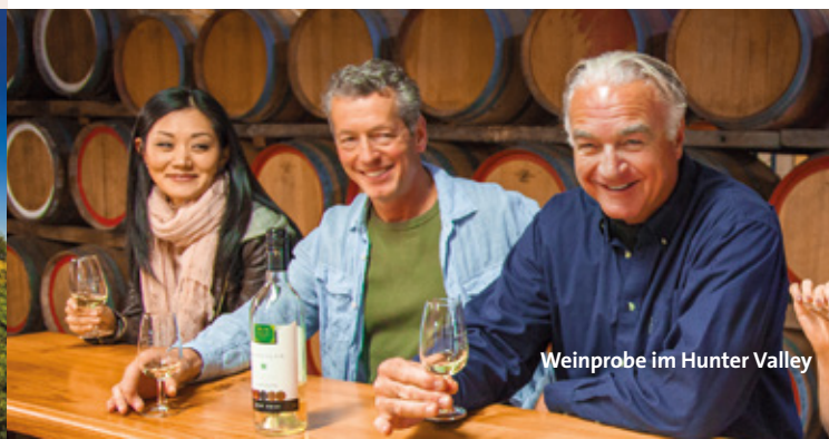
Weinprobe im Hunter Valley